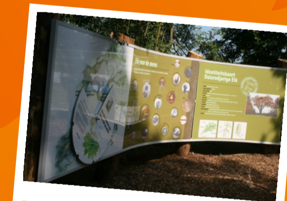
DOMEIN DUIZENDJARIGE EIK