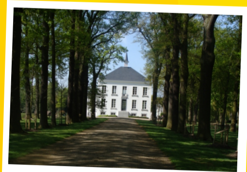
KASTEEL LAGENDAL Thiewinkel