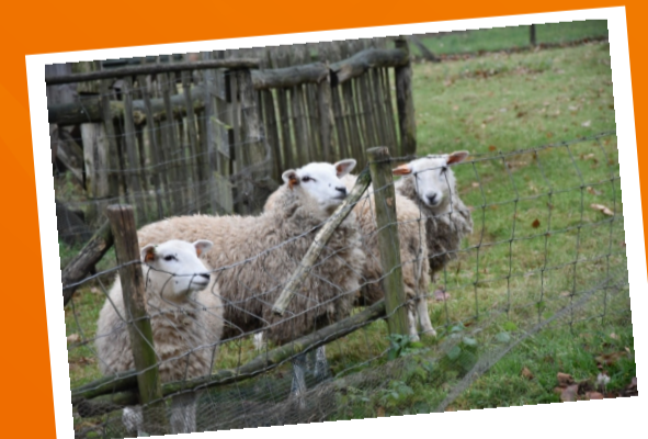
WINDERBOEDERIJ DE WINNING