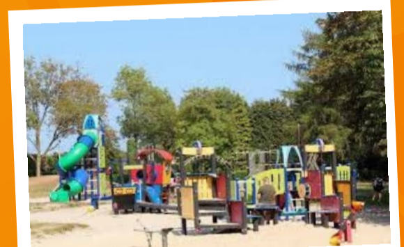
SPEELTUIN AAN SPORTCOMPLEX VIJFSPRONG

Het hele gezin geboeid! Dat is pas een droom. Toch maakt de Lumennekesroute dit werkelijkheid. Ga op een interactieve manier op zoek naar het Lumenneke op het Domein van de Duizendjarige Eik of spot een vogel in de kijkhut. Laat de kinderen ravotten in de speeltuin of spelen met de dieren uit de kinderboerderij terwijl jij intussen geniet van de rustige omgeving of een frisse pint. Haast je dus naar het Gemeenteplein en volg de oranje bordjes voor een korte maar krachtige fietstocht