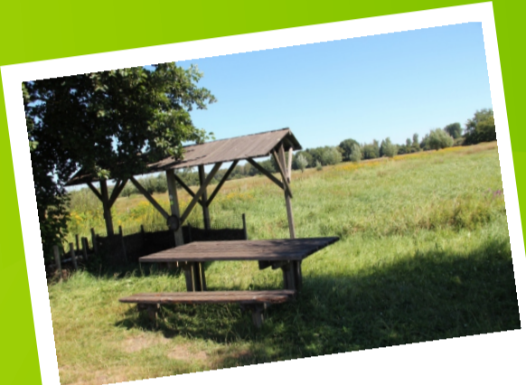
VALLEI VAN DE ZWARTE BEEK

Vijftig tinten groen... Dat heeft het prachtige landschap van de gemeente Lummen jou te bieden. Volg de pijlen op de groene bordjes en fiets langs de Vallei van de Zwarte Beek en de Venusberg naar de Duizendjarige Eik. Velden en weiden worden afgewisseld met hoeves, boerderijdieren, een boomkwekerij, vijvers en het Schulensmeer. Ook op culinair vlak biedt deze fietslus voor elk wat wils. Stop voor een frisse pint bij een café onderweg, sla al wat groenten of vlees in voor het avondeten of verwen jezelf met lekkere aardbeien of een ijsje. Wij nodigen je graag uit om een frisse neus te halen en te genieten van al het groen dat deze fietslus te bieden heeft.