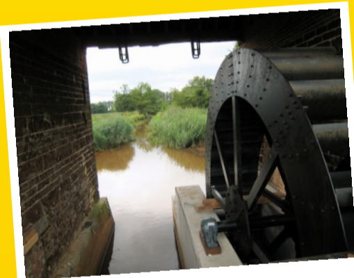
DE KLEEN MEULEN Schalbroek